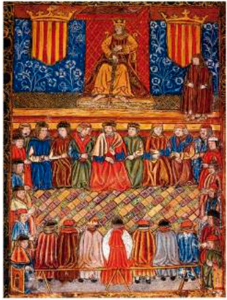
Les 'Corts Catalanes', un des parlements les plus anciens du monde

"Je suis catalan. Il fut un jour où la Catalogne était la plus grande nation du monde. Pourquoi ? Parce que la Catalogne a eu le premier parlement démocratique du globe, bien avant l'Angleterre. C'est aussi dans mon pays qu'il y a eu les premières Nations Unies." C'est en ces mots que le fameux musicien Pau Casals s'exprima au siège des Nations Unies de New York en 1971.