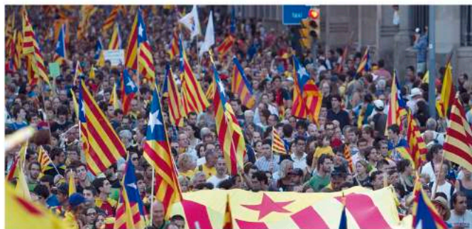
Le 11 septembre, Fête nationale de la Catalogne, des milliers de personnes sortent dans les rues

Chaque 11 septembre, Fête nationale de la Catalogne, des milliers de personnes ont exprimé cette volonté en sortant dans les rues de manière festive, en brandissant l'estelada (drapeau symbolisant la Catalogne indépendante).