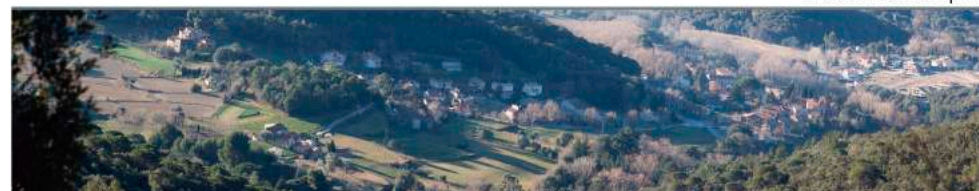
Campins, au cœur de la nature