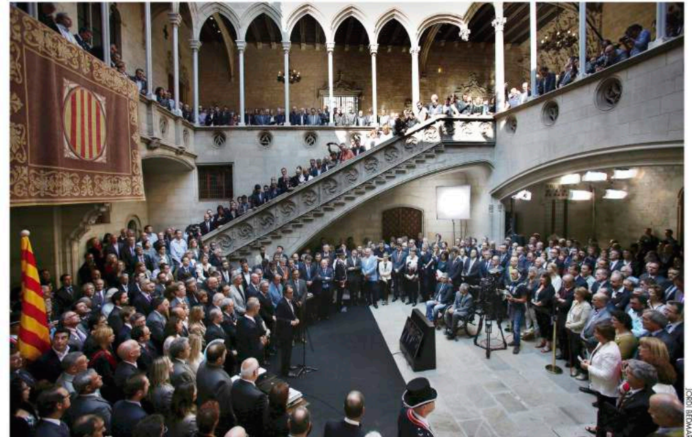
Plus de 900 maires favorables au droit de décider ont manifesté leur soutien au président de la Catalogne en 2014 en faveur de la célébration d'une consultation populaire

efficace afin de mener le processus depuis le niveau local. L'indépendantisme de la Catalogne, politiquement et géographiquement transversal, réclame unitairement la possibilité de voter pour décider de l'avenir de notre pays.