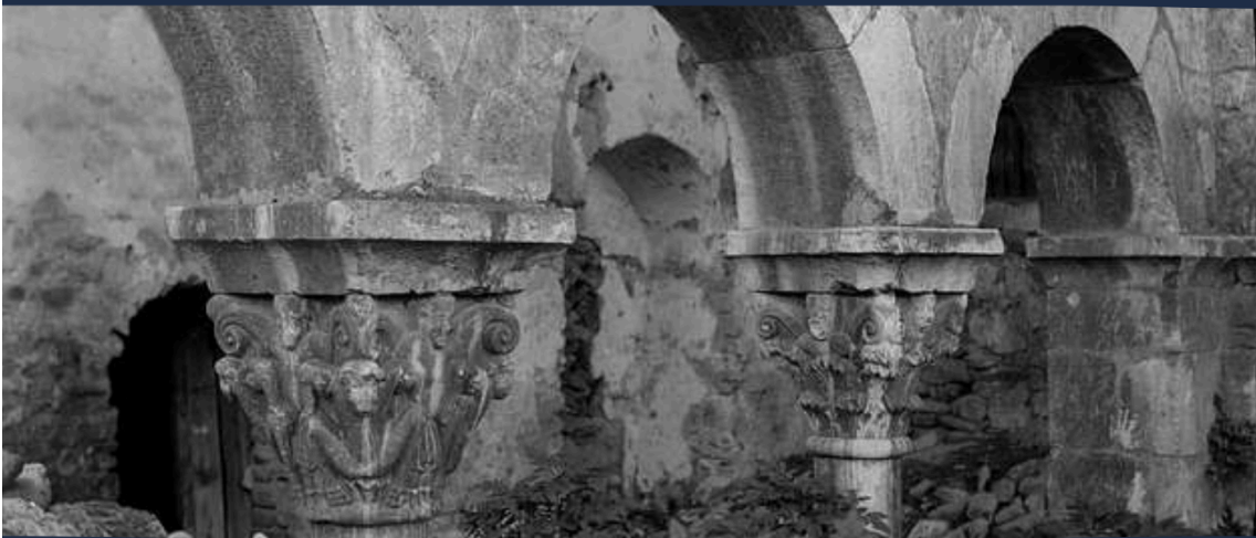
Saint-Michel-de-Cuxa, le cloître

Architecte et historien de l'art, ancien Inspecteur général des Monuments historiques